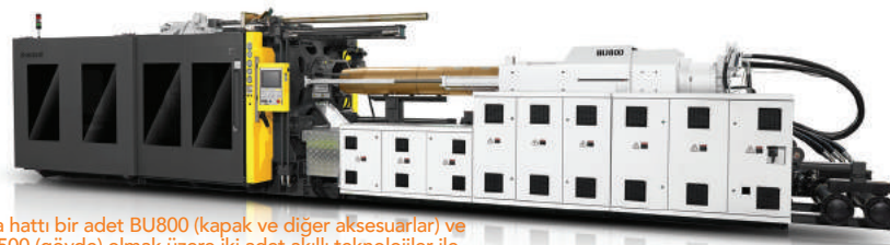
Kova hattı bir adet BU800 (kapak ve diğer aksesuarlar) ve BU1500 (gövde) olmak üzere iki adet akıllı teknolojiler ile donatılmış çift plakalı plastik enjeksiyon makinesinden oluşuyor

Önümüzdeki günlerde gerçekleştirilecek olan PlastEuroasia2017 fuarında, Borche ve Hastek işbirliği ile uzaktan müdahale-arıza giderme donanımı olan Borche IPHM sistemi ile donatılan bir adet çift plakalı plastik enjeksiyon makinesi sergilenecek. Çin Plastik Makine Endüstrisi Birliği Başkanı Kangjian Zhu, PlastEuroasia2017 ile ilgili iyi dileklerini iletirken şu ifadeyi ekliyor: "Çin Plastik Makine sektörü olarak teknolojiye gelişmeler doğrultusunda Türk plastik sektörü ile işbirliğini arttırarak, birlikte daha güzel işlere imza atacağımızı ümit ediyorum."